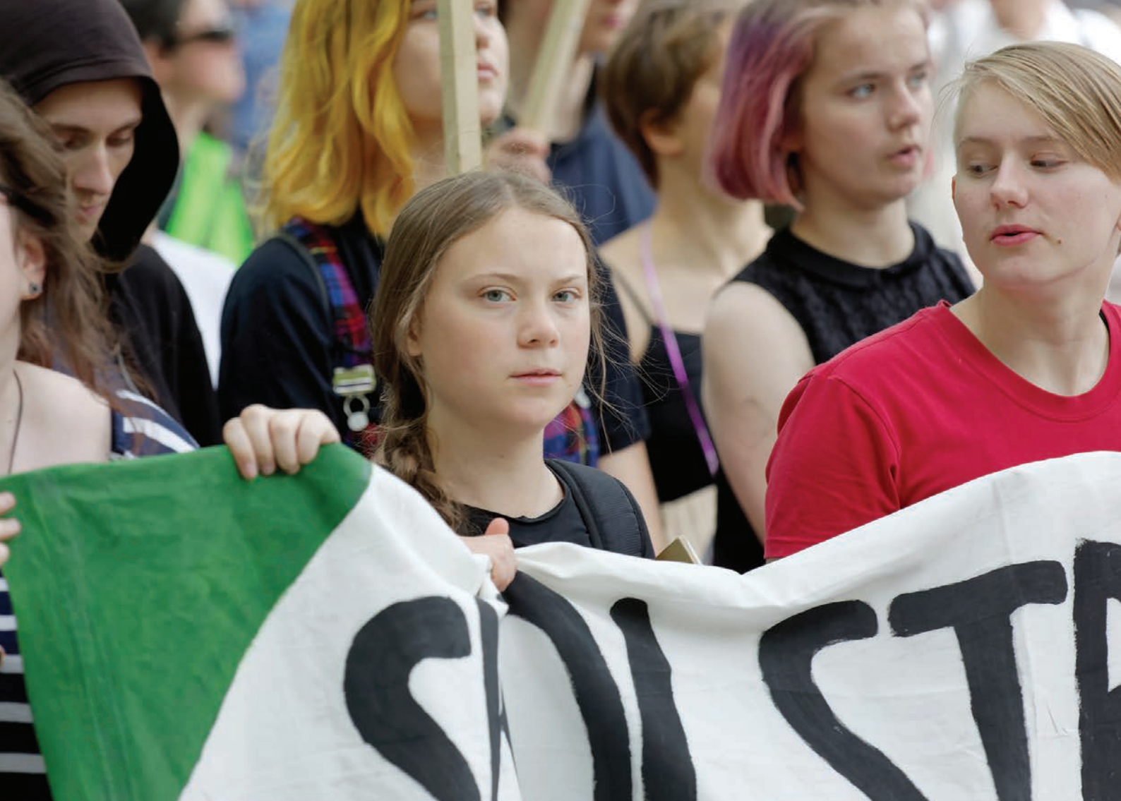
Greta Thunberg har fått ledare över hela världen att lyssna till det tydliga budskapet: Gör som klimatforskarna säger.

ten (2) beskrevs för första gången hållbar utveckling som «en utveckling som tillfredsställer dagens behov utan att äventyra kommande generationers möjligheter att tillfredsställa sina behov». Det är en definition som används än idag och som har fått vara vägledande för allt arbete för en hållbar utveckling sedan dess.